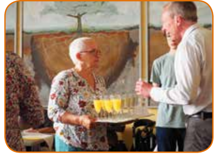
Gute Stimmung und interessante Gespräche nach dem Gottesdienst

Das neue Jahr feiern wir am Vorabend zu Epiphania, Sonntag, 05.01., um 18 Uhr mit einem literarischen Gottesdienst zum neuen Jahr. Im Anschluss stoßen wir gemeinsam auf das neue Jahr an. Zum Wohl!